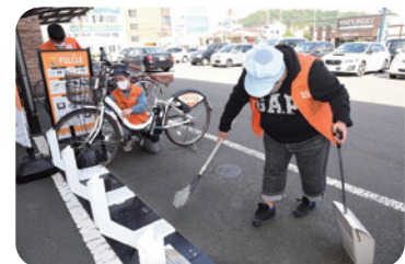
障害福祉支援事業所による清掃風景